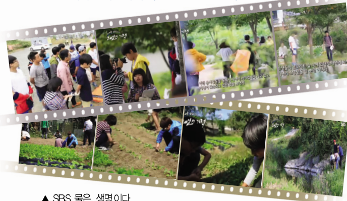
▲ SBS 물은 생명이다