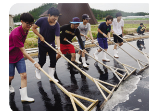
▲ 신안군 증도 염전 체험